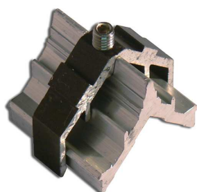
Escuadra mecanizada europea