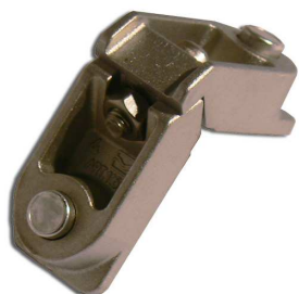
Escuadra pivotes COMUNELLO