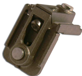
Escuadra pivotes MONTICELLI